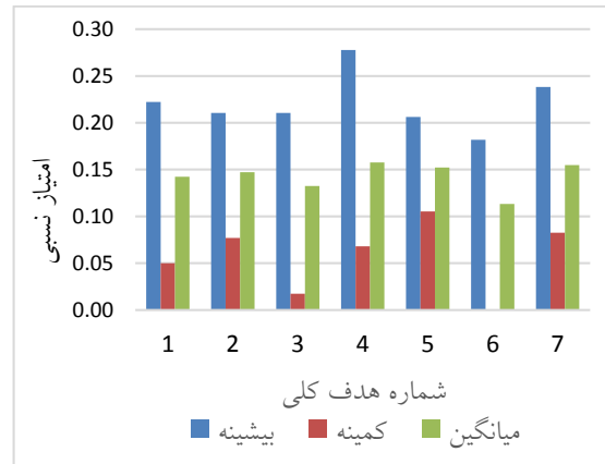
شکل ۱. مقادیر بیشینه، کمینه و میانگین امتیاز نسبی محاسبه شده برای هر هدف کلی ( W_{ij} )