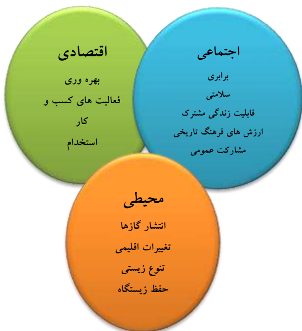
شکل ۱. متغیرهای ضروری مورد بررسی در پایداری

بوده، نه در مواقع خاص. در محیط پویا و پر تلاطم امروزی، عدم توانایی در نوآوری منجر به کسادی کسب و کار شده و بنگاه را وادار به خروج از کسب کار می سازد. [Yam, Guan, Pun, Tang, 2004]