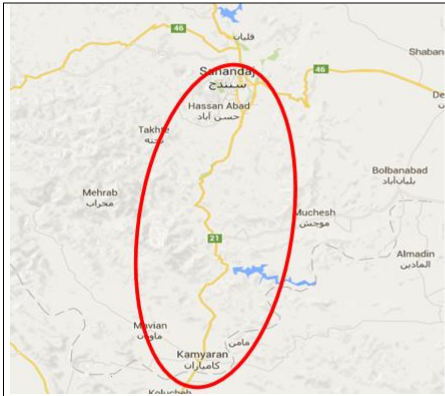
شکل ۳. نقشه مسیر سنندج به سمت کرمانشاه و محدوده مورد بررسی